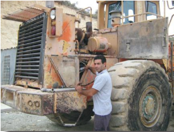
O mecânico adiciona PowerShot® 10 ao óleo do motor.